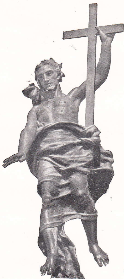
La statua del Redentore sul Monte Ortobene