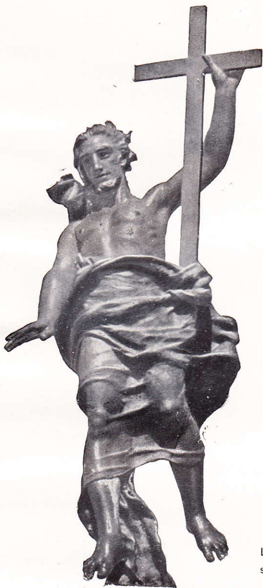
La statua del Redentore sul Monte Ortobene