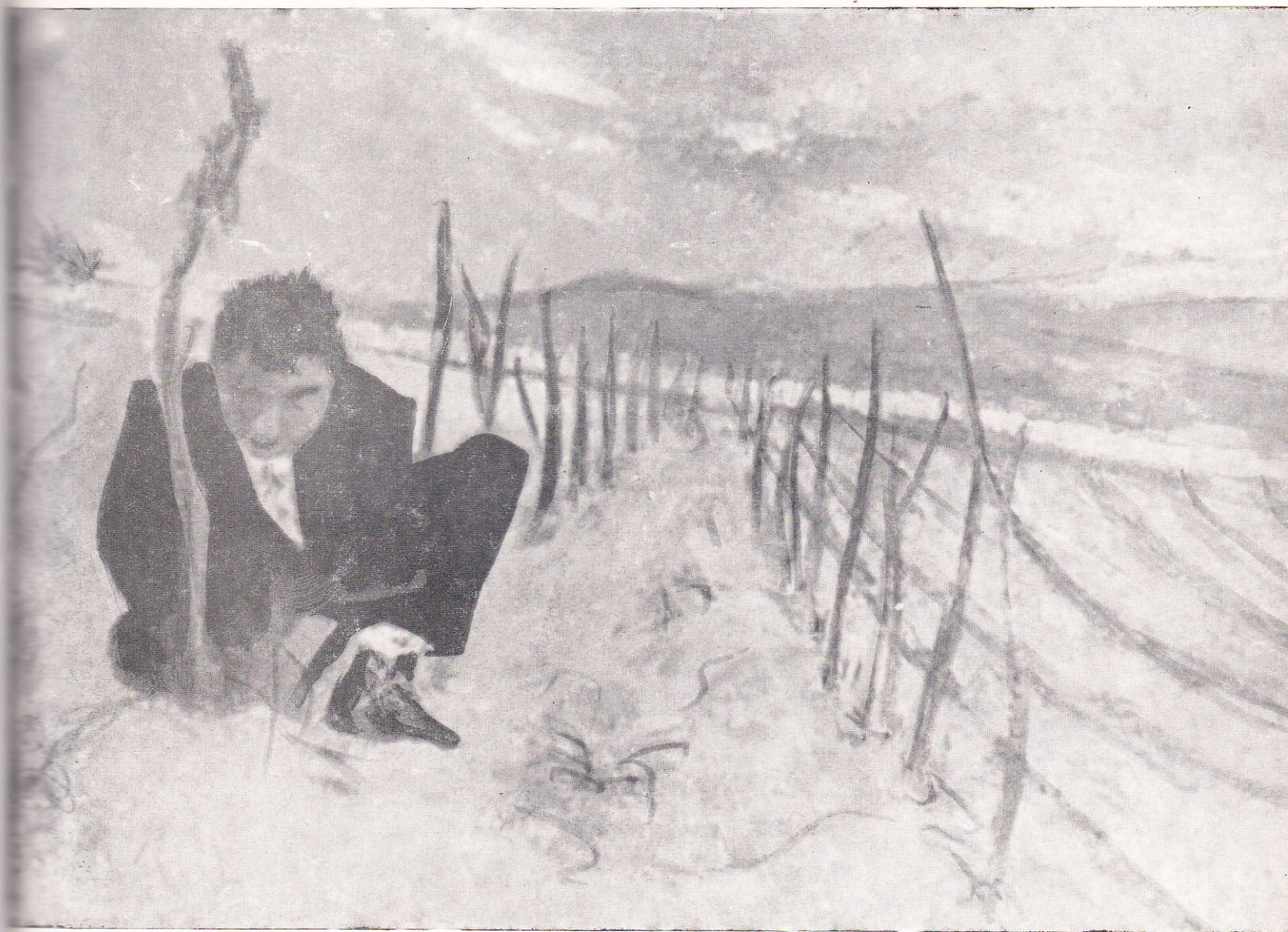
Giovani artisti nuoresi: De Gonare - «Il contadino»