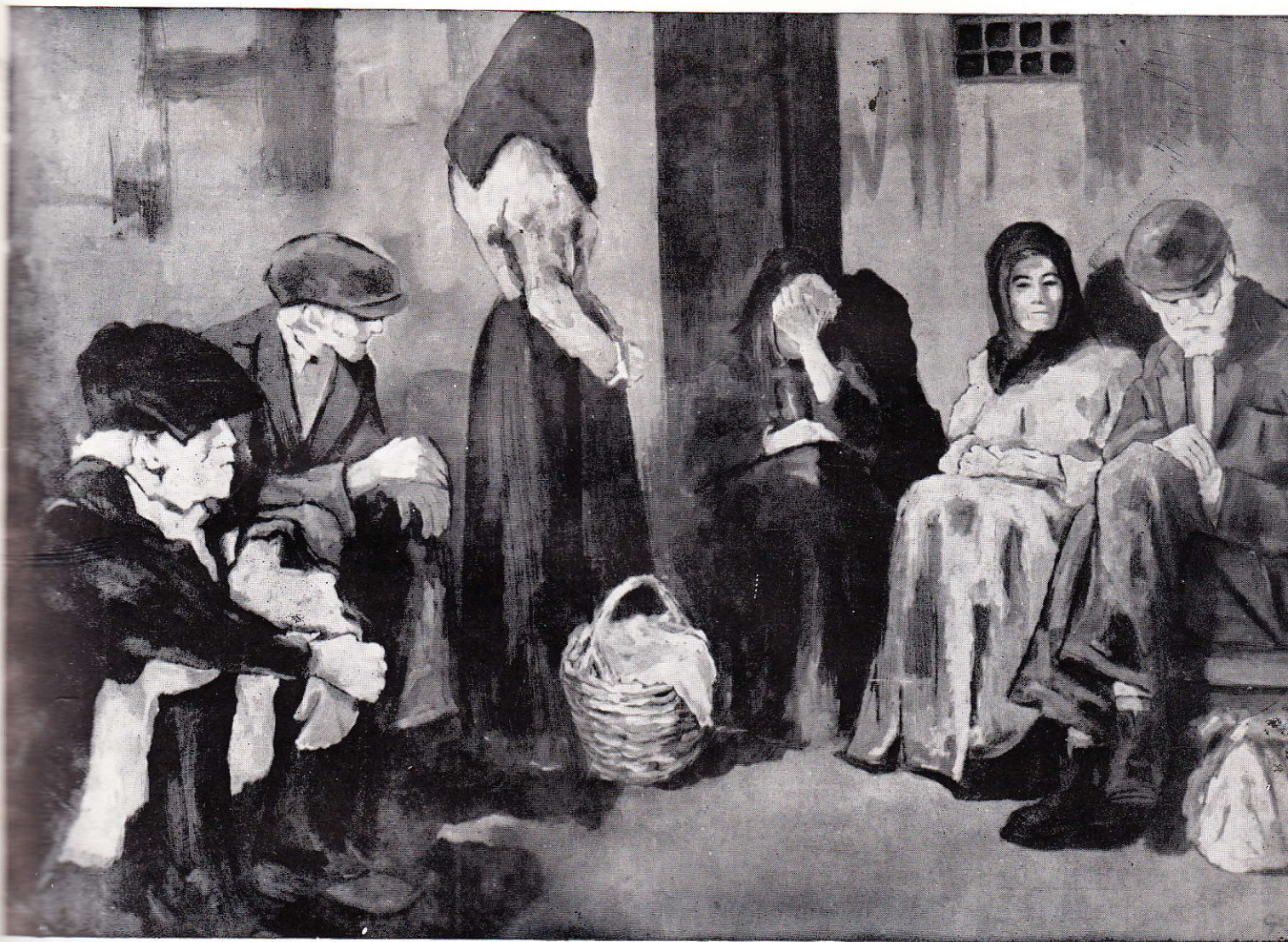
Artisti nuoresi - G. Cadalanu: «L'Attesa» - olio