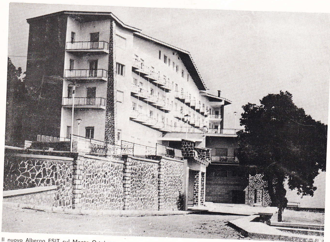
Il nuovo Albergo ESIT sul Monte Ortobene