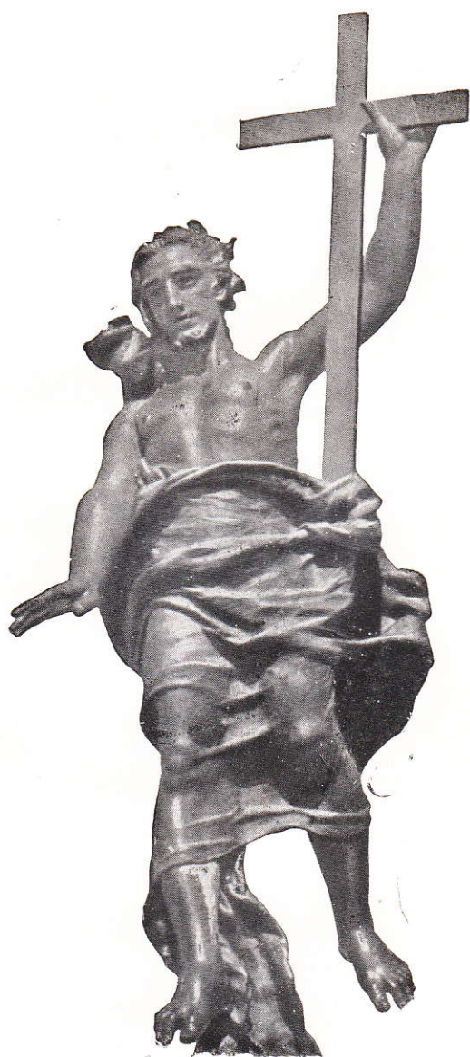
La statua del Redentore sul Monte Ortobene (Nuoro)